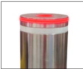
Opcional corona LED