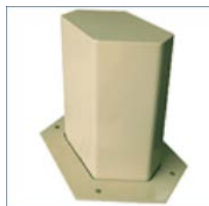
Pilona a medida